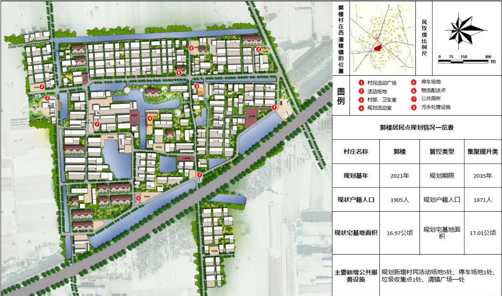
——重点区域规划总平面图