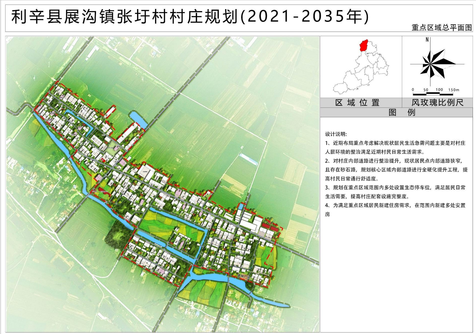
(2) 重点区域总平面图